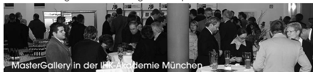
MasterGallery in der IHK Akademie München

Wieder sind es die Automobilen, gefolgt von einigen Finanzdienstleistern, Markenartiklern und der Bundeskanzlerin, die als erste neue Corporate Media-Anwendungen im Internet, aber auch zunehmend auf Flash-Speichern in Form von kleinen portablen Video- oder Daten-Paketen anbieten. Ab sofort bewertet Corporate Media diese Podcast-Lösungen, die auf CD-Trägern oder beliebigen Flashspeichern einzureichen sind.