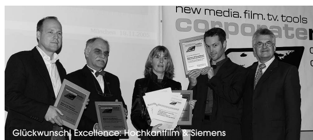
Glückwunsch! Excellence: Hochkanfilm & Siemens